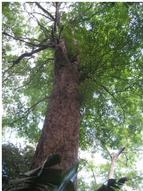
Figura 3: Arvore da Tanimbuca ( Buchenavea huberi )

homenagem a árvore centenária que existe no centro da ilha e que é conhecida como “Tanimbuca” ( Buchenavea huberi Ducke ). Essa árvore mede cerca de 25 m de altura e, apesar de seu caule estar oco em grande parte, calcula-se que suporte um peso de cerca de 30 toneladas. A “Tanimbuca” é comum em toda a Região Amazônica e sua madeira é bastante utilizada, principalmente na construção civil e na construção de móveis (ROCHA; FACHÍN-TERÁN, 2010).