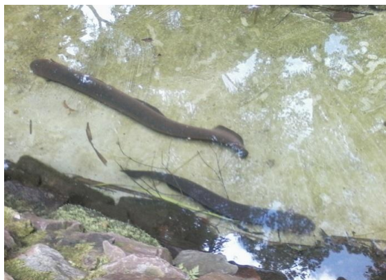
Figura 4: "peixe elétrico" ( Electrophorus electricus , Gymnotidae)

Atividade Proposta: verificação do pH da água e suas propriedades físico- químicas.