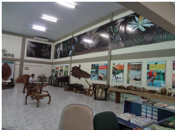
Figura 1: Interior da casa da ciência Fonte: Fachín-Terán, 2010.