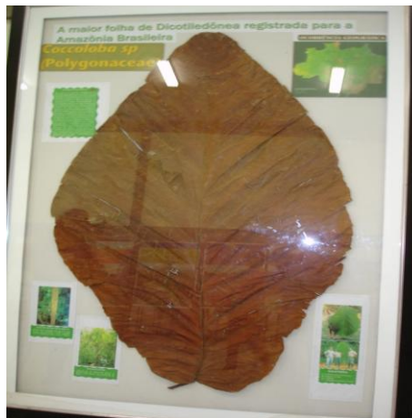
Figura 2: Folha da Cocoloba

1ª Atividade Proposta: Trabalhar conceitos da Geometria Plana (Largura e altura) e Unidades de Medidas