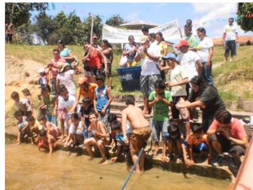
Figura 3: Liberação dos filhotes no lago da comunidade.