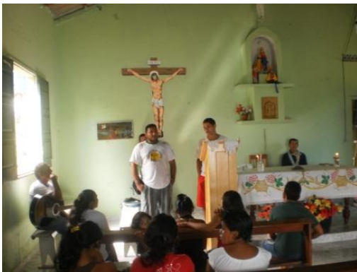
Figura 2: Culto na comunidade para celebrar a soltura dos quelônios.

tem o hábito de consumir os ovos. Nesses locais artificiais chamados de chocadeira, os ovos ficam até a eclosão. Quando isso ocorre, são levados para os tanques berçários, onde os filhotes crescem com segurança, sendo cuidados pelos comunitários com a devida supervisão dos técnicos. Ficam aí de dois a três meses no aguardo da festa comunitária para “celebrar” sua liberação no lago da comunidade. Diz-se celebrar, pois, a comunidade organiza toda uma festa que se inicia pela manhã com cultos ecumênicos (Figura 2), palestras, torneios de futebol, desfiles evidenciando as questões da conservação dos recursos naturais amazônicos e é claro a soltura dos filhotes no lago da comunidade (Figura 3). Enfim, a etapa de soltura é em última instância a celebração comunitária amazônica que atrai ribeirinhos das diversas “Cabeceiras” de rios para a comunidade central, a fim de estar juntos na festa da conservação das riquezas amazônicas.